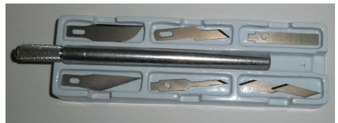
3805-00 Alu-cutter mit 5 Ersatzklingen, 1 Stück

(Glatt/Wellen und Perforierschnitt) 1 Stück