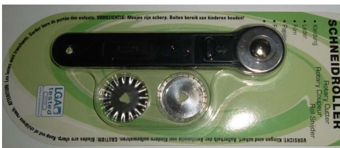
3806-00 Schneidroller, mit 3 Klingen

(Glatt/Wellen und Perforierschnitt) 1 Stück