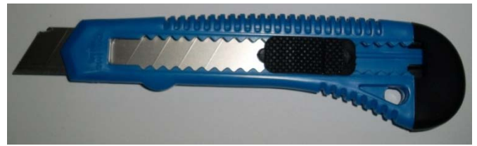
2366-18 Cutter 18mm, Kunststoff, 1 Stück